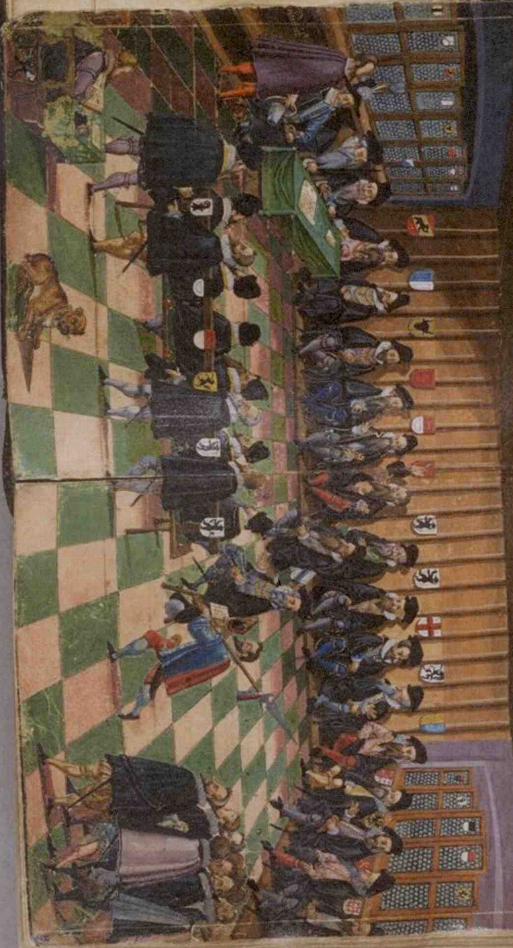
Image de la diète de Baden, tirée de la chronique d'Andreas Ryff, p. 174-175, Musée Historique de Mulhouse, Collection de la Société Industrielle de Mulhouse